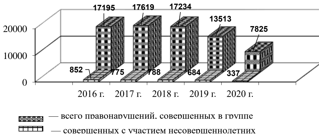
Диаграмма 1 — Сведения о правонарушениях, совершенных в группе, в том числе совершенных с участием несовершеннолетних по Республике Казахстан за 2016-2020 годы

Органы досудебного расследования и суды обязаны указывать какие конкретные действия были совершены взрослым в целях вовлечения несовершеннолетнего в совершение уголовных правонарушений или иных антиобщественных действий.