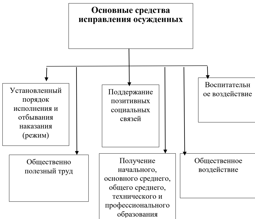
Рисунок 1. Основные средства исправления осужденных

Помогают обеспечивать режим отбывания наказания разного уровня безопасности применяемые исполнительными органами технические средства надзора и контроля за осужденными, оперативно-розыскная деятельность в исправительных учреждениях, применяемые меры безопасности, система учета осужденных, установленный распорядок дня и имеющийся порядок допуска к оборудованию и объектам производства.