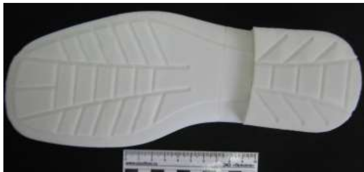
Рисунок 2. Копия подошвы обуви

В целях получения копии следа может быть использован 3D-принтер, печать которого основана на использовании метода послойного создания физического объекта на основе виртуальной 3D-модели. Такие принтеры слой за слоем (толщиной в несколько десятков микрон) создают объемные объекты, нанося полимер на нужные места. После создания копии следа не требуется окончательная обработка.