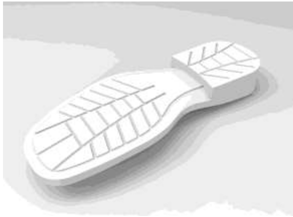
Рисунок 1. Трехмерная модель подошвы обуви

3D-сканер имеет значительные преимущества при сравнении его с традиционным методом фиксирования объемных следов (изготовления гипсового слепка):