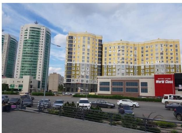
Рисунок 1 – 11 микрорайон

Авторами статьи в качестве эксперимента было исследовано 4 района города, а именно: 11 и 12 микрорайоны, район ЖД вокзала, а также Юго-Западный район города Актобе и даны криминологический анализ внешних факторов, влияющих на криминогенную обстановку в городе Актобе.