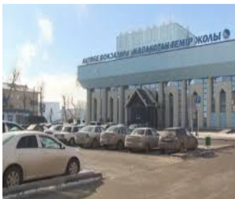
Рисунок 3 – Железнодорожный вокзал ст.Актобе

В городе Актобе одним из криминогенных участков и зоной усиленного риска остаётся район Железнодорожного вокзала ст Актобе. Железнодорожный вокзал — место массового скопления людей, которое притягивает к себе огромное количество различного рода преступников, в связи с чем требует неустанный наблюдения со стороны правоохранительных органов.