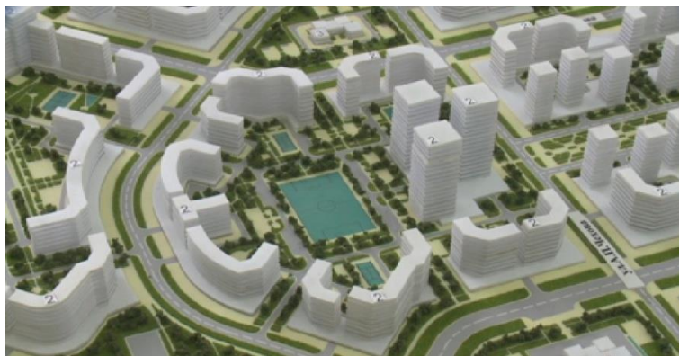
Рисунок 4 – район Юго-Запад

Юго-Западный район расположен в юго-западной части Актобе. Большинство домов — частные. Район «Юго-Запада» города считается новой строительной площадкой в развивающейся части города Актобе. В окрестностях области есть коммунальный рынок «Табыс», Заводской отдел полиции ОП г.Актобе. Существует только одна средняя школа №10 и два детских сада. В окрестностях региона расположены кафе «Ел-мұра», «Атамекен», «Әдем-ай», «Патриция» и «Сұңқар».